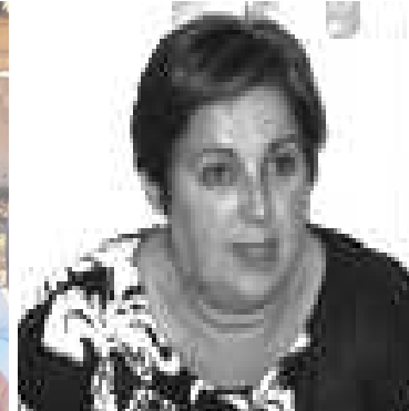
Ex.Alcaldesa (PSOE) Mutxamel Sueldo público: 51.000€ / año