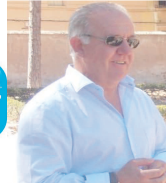
Alcalde (PP) de Mutxamel Sueldo público: 44.000€ / año